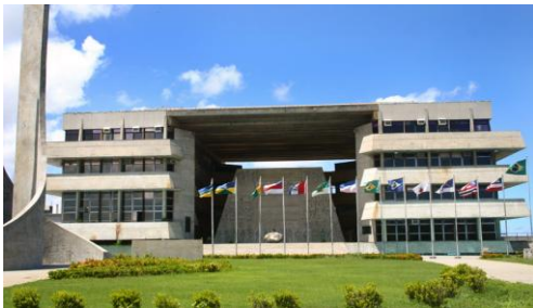
Assembleia Legislativa - BA

Motivados pela igualdade de tratamento pelo governo com a instituição "Polícia"; delegados, escrivães, investigadores, peritos técnicos, criminais, médicos e odonto legais "ocuparam" a Assembléia Legislativa (ALBA), localizada no CAB, nas primeiras semanas de novembro, com o objetivo de