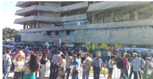
Concentração em frente a AL-BA

A categoria reivindica que o Governo do Estado conceda o mesmo reajuste do vencimento na GAPJ e GAJ; reajuste do auxílio alimentação; integridade da aposentadoria especial e o pagamento da GAPJ e GAJ 4 para os novos policiais.